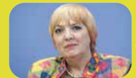
CLAUDIA ROTH Bundestagsvizepräsidentin

Kurzum: Gestalten wir gemeinsam eine Gesellschaft, in der die Würde jedes Menschen tatsächlich im Zentrum steht. Eine Gesellschaft, in der rechtsextreme und antifeministische Bestrebungen möglichst wenig Nährboden vorfinden. Eine solidarische Gesellschaft.