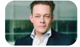
DR. KONSTANTIN VON NOTZ Stellv. Fraktionsvorsitzender