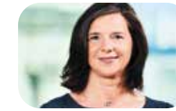
KATRIN GÖRING-ECKARDT Fraktionsvorsitzende