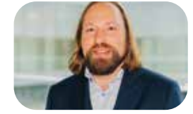
DR. ANTON HOFREITER Fraktionsvorsitzender