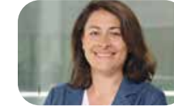
FILIZ POLAT Sprecherin für Migrations- und Integrationspolitik