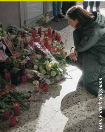
Katrin Göring-Eckardt am Ort des Anschlags in Hanau.

Rechtsextreme Gewalttäter bekommen immer noch zu einfach Zugang zu Waffen. Zwar wurde das Waffenrecht Mitte Februar verschärft, aber nicht konsequent genug. Es bleibt beispielsweise problematisch, dass Sportschützen ihre Waffen und Munition zu Hause lagern dürfen. Das muss aus unserer Sicht geändert werden.