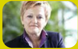
RENA TE KÜNAST Sprecherin für Ernährungspolitik

Der Hass, der sich nicht nur im Netz äußert, ist keine Privatangelegenheit einzelner. Dahinter steht eine Strategie des organisierten Rechtsextremismus. Sein Ziel ist es, demokratische Strukturen zu zerstören. In wohl orchestrierten Hass-Kampagnen wollen seine Propagandisten und Anhänger engagierte Menschen mundtot machen. Der öffentlich verbreitete Hass bildet zugleich den Nährboden für weitere Radikalisierung, bei der aus Worten auch Taten werden. Fast 200 Menschen sind seit dem November 1990 von Rechtsextremisten ermordet worden – es begann nicht erst in Kassel, Halle oder Hanau. Wir stehen in der Verantwortung, vom Recht bis zu Prävention und Schutz jetzt alle Werkzeuge zu nutzen.