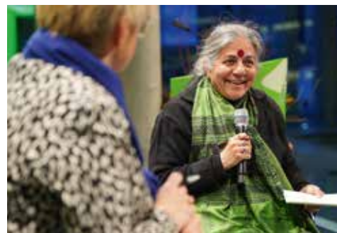
Renate Künast im Gespräch mit Vandana Shiva