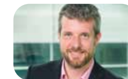
DIETER JANECEK Sprecher für Industriepolitik und digitale Wirtschaft